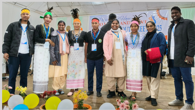
Photo de la PJV de Northeast India Province

Coordinateurs par mission : à nommer prochainement.