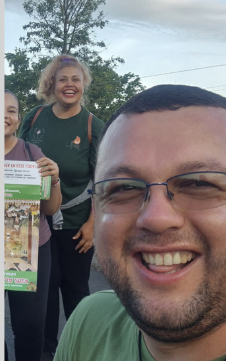
Photo de la PJV San José del Sur