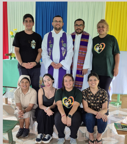
Photos de PJV de San José del Sur